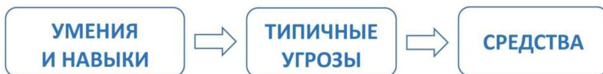
Рис. 4. Общий алгоритм выбора средств информационной гигиены

Выбор средств обеспечения информационной гигиены должен осуществляться сообразно базовой группе умений и навыков в зависимости от характера конкретных угроз (рис. 4).