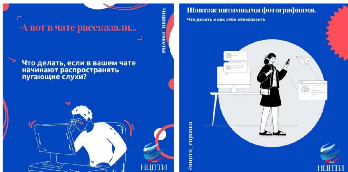
Рис. 13. Разъясняющие карточки НЦПТИ

НЦПТИ был создан в 2012 году на базе НИИ «Спецвузавтоматика» с целью оказания информационно-аналитического, методического и технологического сопровождения деятельности ФОИВ, ОИВ субъектов Российской Федерации и образовательных организаций по противодействию идеологии терроризма и иным радикальным проявлениям в образовательной сфере и молодежной среде. Несмотря на то что профильными являются указанные выше цели, на сайте есть образовательный контент, направленный на формирование базовых представлений об информационной гигиене (рис. 13). Кроме того, НЦПТИ проводит тематические профилактические мероприятия, например Киберквиз.