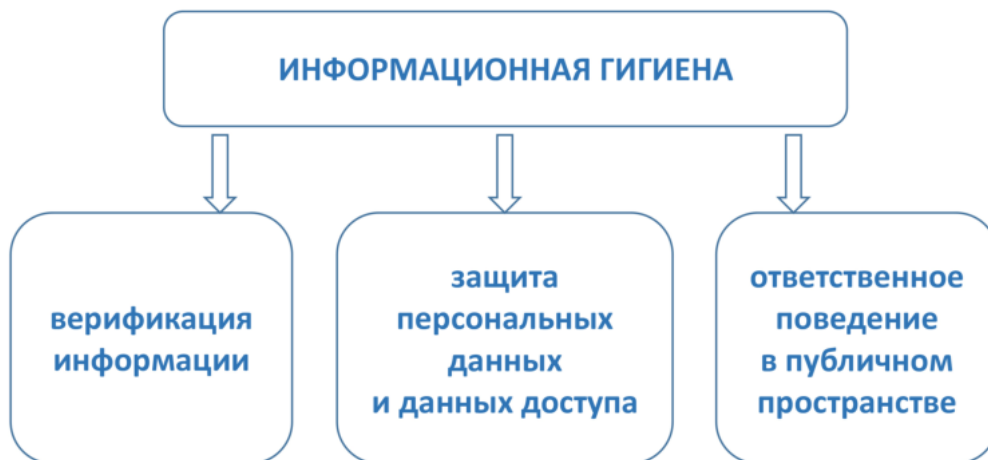
Рис. 2. Базовые умения и навыки информационной гигиены

В соответствии с указанными умениями будут варьироваться угрозы, против которых должны быть направлены навыки информационной гигиены.