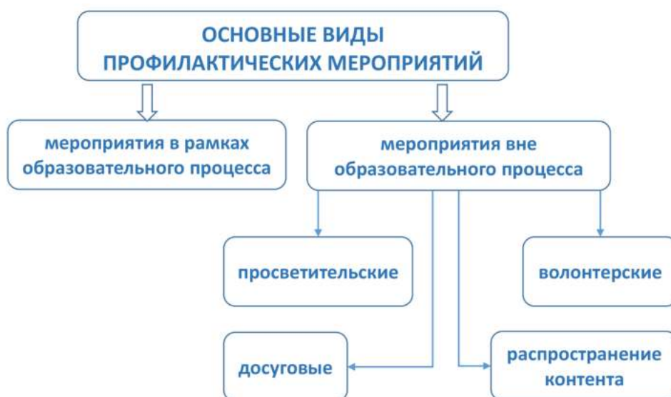
Рис. 6. Основные виды профилактических мероприятий

Следует отметить, что форм и видов профилактических мероприятий может быть множество, как и форм любой образовательной и воспитательной деятельности. Поэтому далее будут приведены лишь некоторые варианты. Основными видами при этом будут профилактические мероприятия в рамках учебного процесса и за его пределами, включая просветительскую деятельность, досуг, изготовление и распространение профилактического контента, волонтерство (рис. 6).