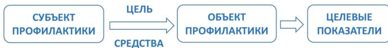
Рис. 3. Структура профилактической работы

Профилактическая работа, направленная на формирование умений и навыков информационной гигиены, должна начинаться с четкого понимания субъекта, объекта, целей, средств и результатов данной деятельности (рис. 3). Кроме того, следует представлять спектр угроз, которым призвана противостоять информационная гигиена и которые будут подробнее охарактеризованы ниже. Также важно помнить, что только жесткая привязка к практикам современной повседневности, касающимся каждого индивида, взаимодействующего с информационной средой, только указание конкретных примеров из жизни, связанных с нарушением законных прав и свобод гражданина, могут обеспечить подлинный интерес целевой аудитории проводимой работы.