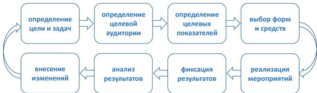
Рис. 5. Общий алгоритм профилактической деятельности