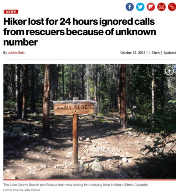
Рис. 7. Статья из газеты «Нью-Йорк Пост» о потерявшемся туристе, который не отвечал на звонки с незнакомых номеров

Одной из сложностей, которые могут возникнуть с проведением такого вида занятий, является возбуждение интереса аудитории, которая в рамках учебного процесса может ничего особенного не ждать от преподавателя, воспринимая урок как рутину. Здесь важно начать занятие с какого-то интересного случая или примера того, как знание или незнание основ информационной гигиены сказывается на жизни людей. Так, буквально недавно заблудившийся турист из Колорадо сутки не отвечал на звонки спасателей, так как они были с незнакомого номера 1 (рис. 7). К счастью, все обошлось, однако такая явно невротическая установка могла привести к трагедии. Все потому, что для человека, плохо владеющего навыками информационной гигиены, действительно любой незнакомый звонок становится проблемой и ввергает в состояние страха и растерянности, хотя в таких случаях важно не терять самообладание и помнить, что с незнакомого номера может звонить близкий человек, у которого сел или пропал телефон.