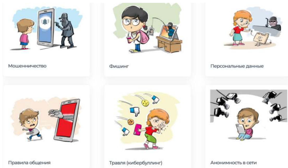
Рис. 10. Информационные памятки для детей и подростков с сайта Лиги безопасного Интернета