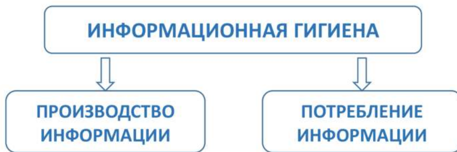
Рис. 1. Векторы применения информационной гигиены

Исходя из поставленной задачи, целесообразно дать следующее определение: информационная гигиена — это совокупность компетенций, позволяющих обеспечить безопасность взаимодействия индивида с информационной средой и направленных на формирование умений и навыков осознанного и ответственного потребления и производства (распространения) информации.