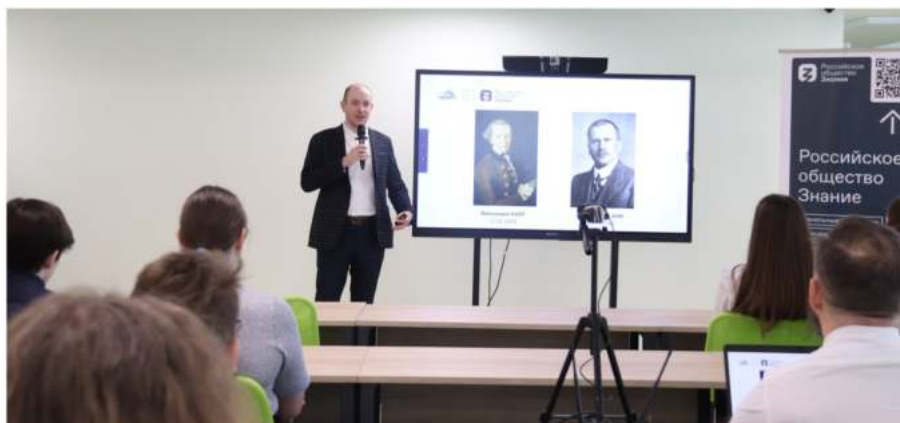
Рис. 9. Публичная просветительская лекция «Критическое мышление и информационная гигиена», организованная Российским обществом «Знание» 1 и проходившая на базе МАУ СОШ № 59 г. Калининграда с интернет-трансляцией для 11 школ Калининградской области (всего очно и дистанционно в мероприятии приняли участие 180 учащихся)

Особенности: как правило, подобный формат реализуется в свободное от образовательного процесса время. При этом открытая лекция может проходить как в стенах образовательного учреждения (рис. 9), так и любого учреждения культуры, молодежной политики или вообще на независимых площадках. Например, такие мероприятия востребованы библиотеками, молодежными клубами, муниципальными культурно-досуговыми центрами. Если нет возможности напрямую контактировать с данными организациями, то можно обратиться к их учредителям — региональным органам государственной власти и местного самоуправления. Помощь в организации подобных открытых лекций могут оказывать также некоммерческие организации, в частности Российское общество «Знание». Для реализации этого вида профилактических мероприятий одним из самых важных требований является качественно подготовленная презентация. Также в конце выступления обязательно необходимо оставлять время на вопросы из аудитории.